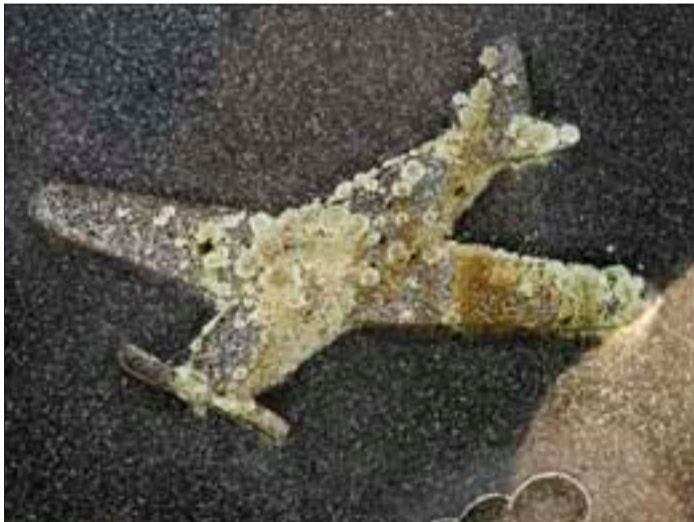
Lentokone kasvaa kauniisti jäkälää lentomestarin hautakivessä.

– Täällä käy paljon koululaisia. Ajattelimme että he voivat oppia paitsi kulttuurista ja historiasta, myös luonnosta, sanoo