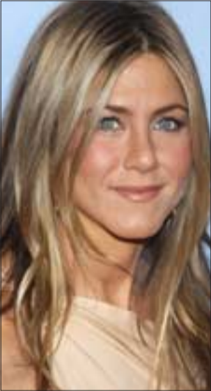
Jennifer Aniston opiskeles seuraavassa filmissään hippikommuunin elämäntapoja.