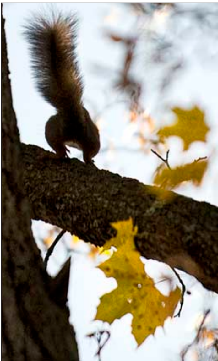
Oravat ovat Kalevankankaan vakioasukkaita, vaahteranlehdet täyttävät parhaillaan käytäviä urakalla.