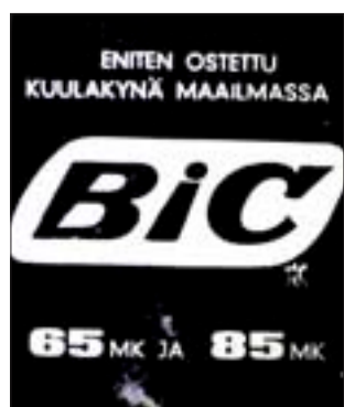
Ilmoitus Aamulehdessä 9.10.1960