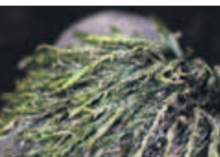
Puron kivissä asustavaa isonäkinnäköistä kätkettyä. Kätkettyä on jopa hirsitalojen tilkitsemiseen; se on hyvä eriste tulta vastaan.