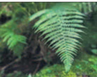
Hiirenporrans viihtyy purojen ja lähteiden läheisyydessä.