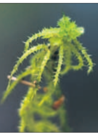
Okarahkasammal viihtyy puron liepeillä Rudangonmaalla.

→ www.sll.fi/luontojymparisto/vesistot/pienvedet