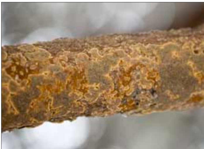
Rosoinen riukukääpä kasvaa vanhassa metsässä.