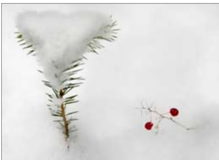
Kuusen alkku ja oravanmarja miettivät, miten talvesta selviävät.