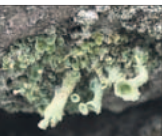
Kivilinnan kivissä kasvaa muun muassa suppilorvijäkälää.

Koska kalliota ei tule lisää, on kulutuksen vähentäminen, kiviaineksen kierrättäminen ja uusiutuvien materiaalien kehittäminen ainoa vaihtoehto.